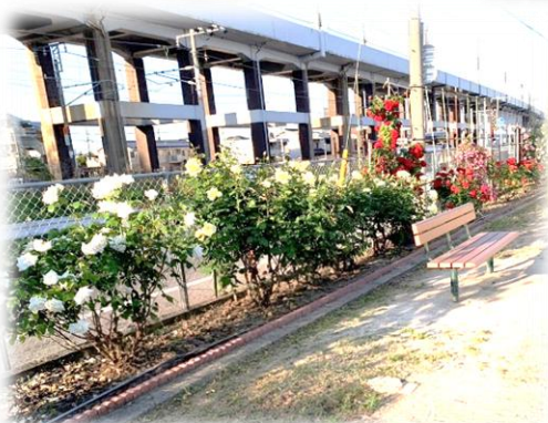
丁分町内会 東部13公園