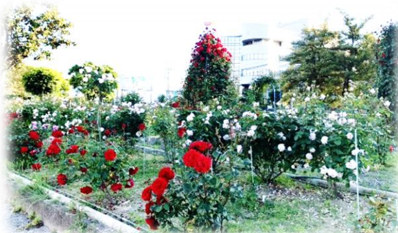
水辺町内会 水辺公園