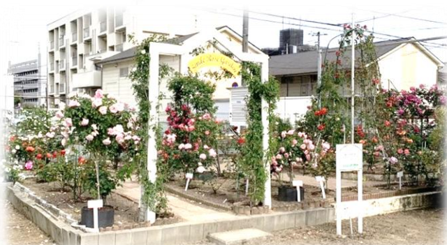
深津小学校 学校花壇【ばらづくり賞】