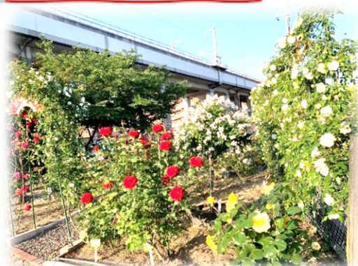
西浜町内会 辻の坂広場