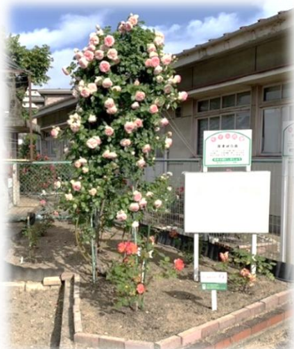
深津ばら花壇 深津緑地

3月26日深津交流館大会議室にて、映画「怪盗グルーミニオン超変身」の鑑賞会を開催しました。小学校の春休み初日ということもあり、たくさんのお子どもたちに来ていただき、会場は笑顔と歓声に包まれました。